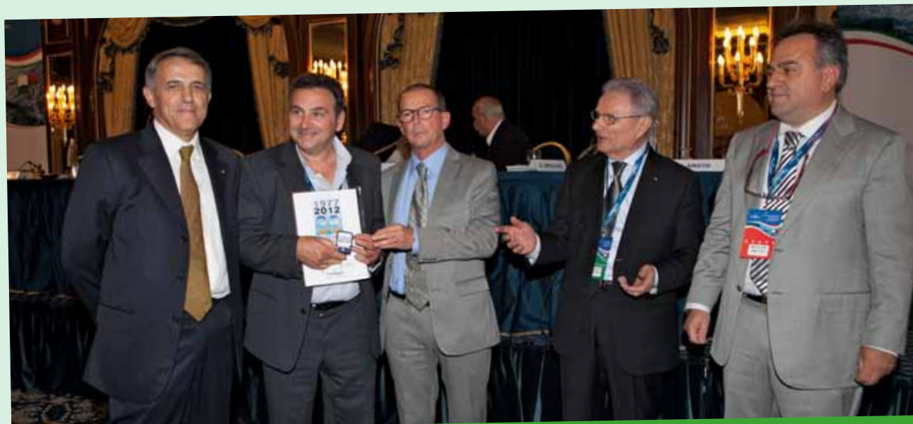
SANTANGELO FRANCO rubinetteria - SAN MAURIZIO D'OPAGLIO