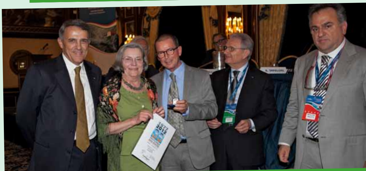
BAFFIGO CARLA biscottificio - NOVARA