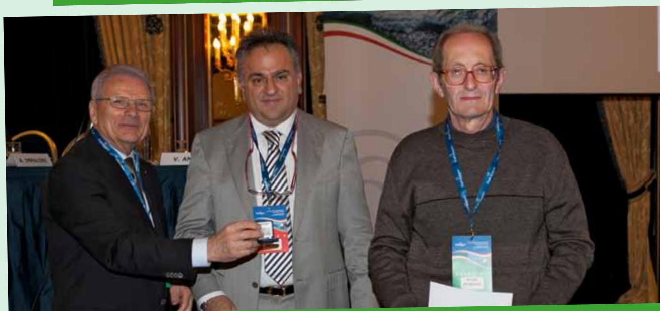
RIGHI ROMANO rubinetteria - POGNO