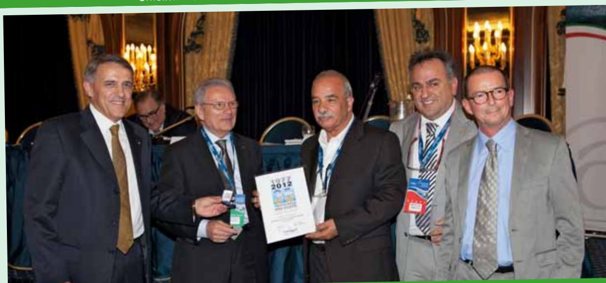
AMATO VINCENZO produzione articoli casalinghi in metallo - ARMENO