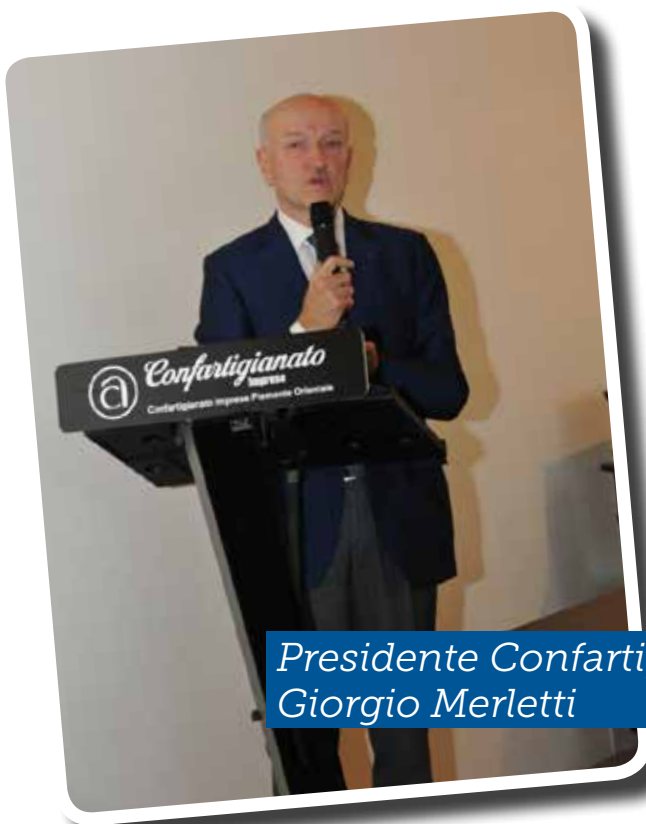
Presidente Confartigianato Giorgio Merletti