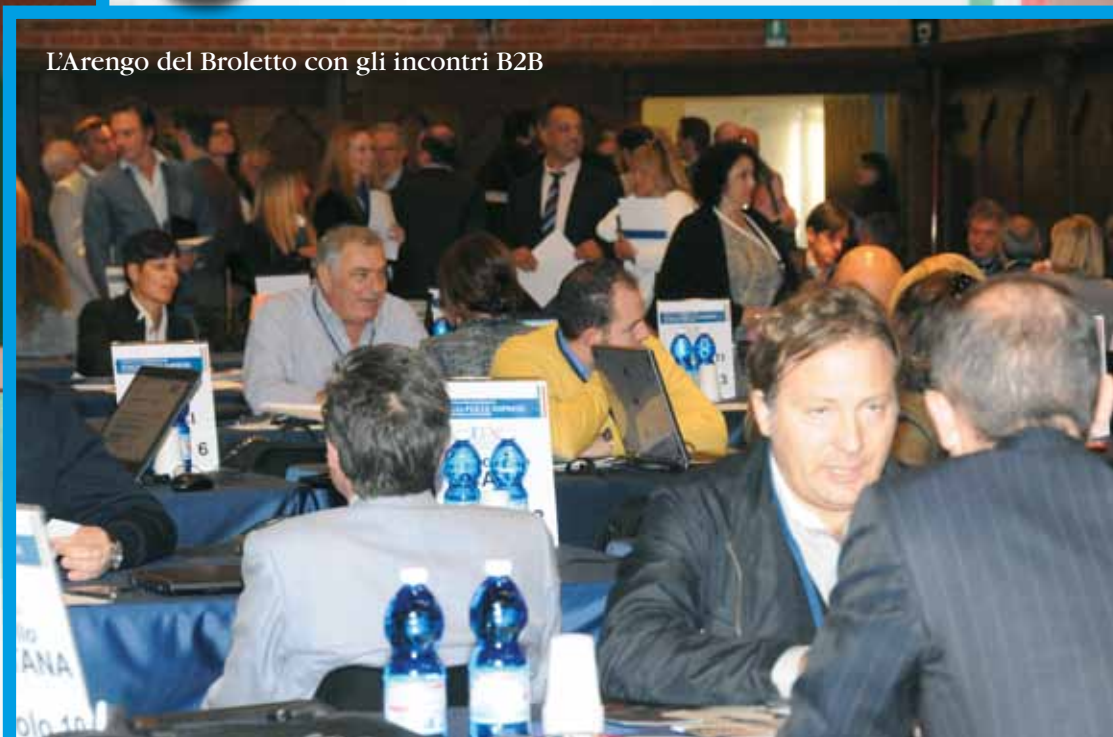
L'Arengo del Broletto con gli incontri B2B