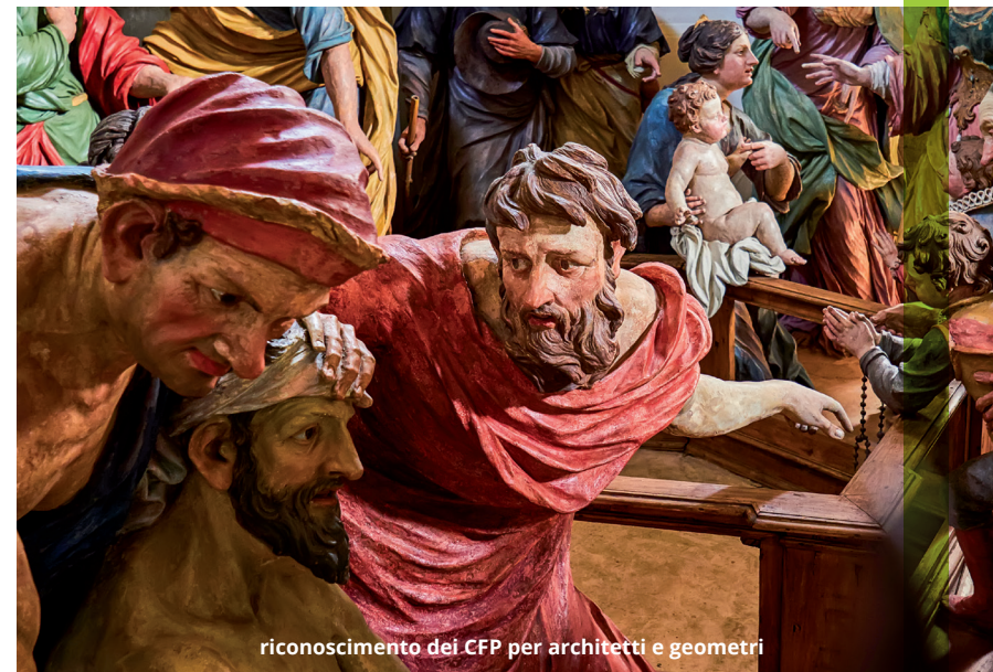
riconoscimento dei CFP per architetti e geometri