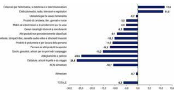
Primo bimestre 2021. Variazione cumulata percentuale tendenziale - Elaborazione Ufficio Studi Confartigianato su dati Istat